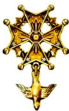
Croix huguenote ▶ Bijou caractéristique du protestantisme français.

en suivant les traces laissées par l'histoire